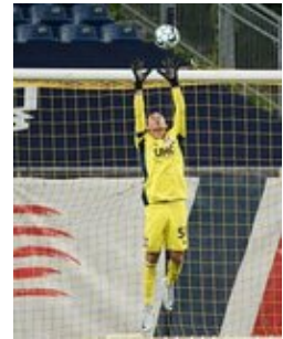
REVS_II_vs_RED_WOLVES_...REVS_II_vs_RED_WOLVES_...REVS_II_vs_RED_WOLVES_...REVS_II_vs_RED_WOLVES_... CAP2020USL1 RIICRW0184 CAP2020USL1 RIICRW1363 CAP2020USL1 RIICRW0876 CAP2020USL1 RIICRW0544