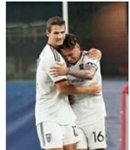
REVS_II_vs_RED_WOLVES_...REVS_II_vs_RED_WOLVES_...REVS_II_vs_RED_WOLVES_...REVS_II_vs_RED_WOLVES_... CAP2020USL1 RIICRW0965 CAP2020USL1 RIICRW0398 CAP2020USL1 RIICRW1373 CAP2020USL1 RIICRW1385