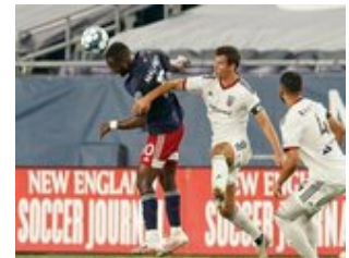
REVS_II_vs_RED_WOLVES...REVS_II_vs_RED_WOLVES...REVS_II_vs_RED_WOLVES...REVS_II_vs_RED_WOLVES... CAP2020USL1 RIICRW0307 CAP2020USL1 RIICRW0082 CAP2020USL1 RIICRW0151 CAP2020USL1 RIICRW0657