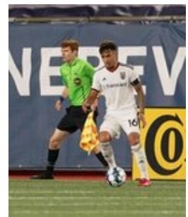
REVS_II_vs_RED_WOLVES_...REVS_II_vs_RED_WOLVES_...REVS_II_vs_RED_WOLVES_...REVS_II_vs_RED_WOLVES_... CAP2020USL1 RIICRW0716 CAP2020USL1 RIICRW0150 CAP2020USL1 RIICRW1000 CAP2020USL1 RIICRW0601