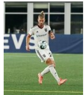
REVS_II_vs_RED_WOLVES_...REVS_II_vs_RED_WOLVES_...REVS_II_vs_RED_WOLVES_...REVS_II_vs_RED_WOLVES_... CAP2020USL1 RIICRW0014 CAP2020USL1 RIICRW0044 CAP2020USL1 RIICRW1276 CAP2020USL1 RIICRW1171