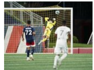
REVS_II_vs_RED_WOLVES...REVS_II_vs_RED_WOLVES...REVS_II_vs_RED_WOLVES...REVS_II_vs_RED_WOLVES... CAP2020USL1 RIICRW0051 CAP2020USL1 RIICRW0147 CAP2020USL1 RIICRW1188 CAP2020USL1 RIICRW0561