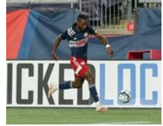
REVS_II_vs_RED_WOLVES_...REVS_II_vs_RED_WOLVES_...REVS_II_vs_RED_WOLVES_...REVS_II_vs_RED_WOLVES_... CAP2020USL1 RIICRW0473 CAP2020USL1 RIICRW0174 CAP2020USL1 RIICRW1352 CAP2020USL1 RIICRW0769