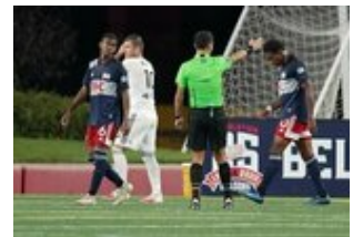
REVS_II_vs_RED_WOLVES_...REVS_II_vs_RED_WOLVES_...REVS_II_vs_RED_WOLVES_...REVS_II_vs_RED_WOLVES_... CAP2020USL1 RIICRW1190 CAP2020USL1 RIICRW1143 CAP2020USL1 RIICRW1406 CAP2020USL1 RIICRW1048