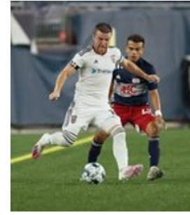
REVS_II_vs_RED_WOLVES...REVS_II_vs_RED_WOLVES...REVS_II_vs_RED_WOLVES...REVS_II_vs_RED_WOLVES... CAP2020USL1 RIICRW0552 CAP2020USL1 RIICRW0269 CAP2020USL1 RIICRW0043 CAP2020USL1 RIICRW0937