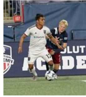
REVS_II_vs_RED_WOLVES_...REVS_II_vs_RED_WOLVES_...REVS_II_vs_RED_WOLVES_...REVS_II_vs_RED_WOLVES_... CAP2020USL1 RIICRW0900 CAP2020USL1 RIICRW0442 CAP2020USL1 RIICRW0160 CAP2020USL1 RIICRW1328