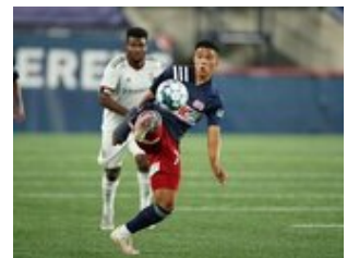
REVS_II_vs_RED_WOLVES...REVS_II_vs_RED_WOLVES...REVS_II_vs_RED_WOLVES...REVS_II_vs_RED_WOLVES... CAP2020USL1 RIICRW1435 CAP2020USL1 RIICRW0779 CAP2020USL1 RIICRW0069 CAP2020USL1 RIICRW0502