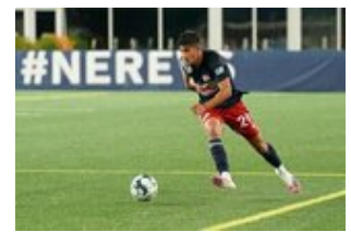
REVS_II_vs_RED_WOLVES...REVS_II_vs_RED_WOLVES...REVS_II_vs_RED_WOLVES...REVS_II_vs_RED_WOLVES... CAP2020USL1 RIICRW1230 CAP2020USL1 RIICRW0635 CAP2020USL1 RIICRW1129 CAP2020USL1 RIICRW1391