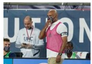
REVS_II_vs_RED_WOLVES_...REVS_II_vs_RED_WOLVES_...REVS_II_vs_RED_WOLVES_...REVS_II_vs_RED_WOLVES_... CAP2020USL1 RIICRW0123 CAP2020USL1 RIICRW0602 CAP2020USL1 RIICRW1184 CAP2020USL1 RIICRW0541