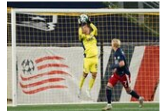
REVS_II_vs_RED_WOLVES_...REVS_II_vs_RED_WOLVES_...REVS_II_vs_RED_WOLVES_...REVS_II_vs_RED_WOLVES_... CAP2020USL1 RIICRW1375 CAP2020USL1 RIICRW1367 CAP2020USL1 RIICRW0061 CAP2020USL1 RIICRW0545