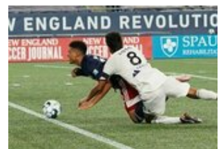
REVS_II_vs_RED_WOLVES...REVS_II_vs_RED_WOLVES...REVS_II_vs_RED_WOLVES...REVS_II_vs_RED_WOLVES... CAP2020USL1 RIICRW0861 CAP2020USL1 RIICRW0840 CAP2020USL1 RIICRW0138 CAP2020USL1 RIICRW1116