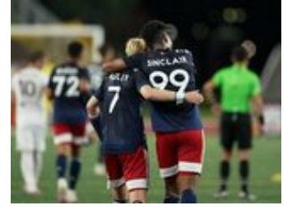
REVS_II_vs_RED_WOLVES...REVS_II_vs_RED_WOLVES...REVS_II_vs_RED_WOLVES...REVS_II_vs_RED_WOLVES... CAP2020USL1 RIICRW1013 CAP2020USL1 RIICRW0605 CAP2020USL1 RIICRW1469 CAP2020USL1 RIICRW1079