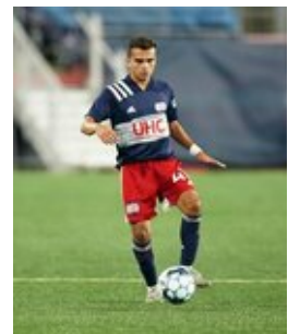
REVS_II_vs_RED_WOLVES_...REVS_II_vs_RED_WOLVES_...REVS_II_vs_RED_WOLVES_...REVS_II_vs_RED_WOLVES_... CAP2020USL1 RIICRW0288 CAP2020USL1 RIICRW0059 CAP2020USL1 RIICRW1098 CAP2020USL1 RIICRW0641