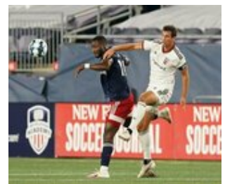
REVS_II_vs_RED_WOLVES...REVS_II_vs_RED_WOLVES...REVS_II_vs_RED_WOLVES...REVS_II_vs_RED_WOLVES... CAP2020USL1 RIICRW0230 CAP2020USL1 RIICRW1053 CAP2020USL1 RIICRW0092 CAP2020USL1 RIICRW0659