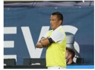
REVS_II_vs_RED_WOLVES_...REVS_II_vs_RED_WOLVES_...REVS_II_vs_RED_WOLVES_...REVS_II_vs_RED_WOLVES_... CAP2020USL1 RIICRW1242 CAP2020USL1 RIICRW0987 CAP2020USL1 RIICRW0104 CAP2020USL1 RIICRW0542