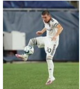
REVS_II_vs_RED_WOLVES_...REVS_II_vs_RED_WOLVES_...REVS_II_vs_RED_WOLVES_...REVS_II_vs_RED_WOLVES_... CAP2020USL1 RIICRW0526 CAP2020USL1 RIICRW0257 CAP2020USL1 RIICRW0727 CAP2020USL1 RIICRW0917