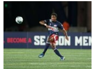
REVS_II_vs_RED_WOLVES...REVS_II_vs_RED_WOLVES...REVS_II_vs_RED_WOLVES...REVS_II_vs_RED_WOLVES... CAP2020USL1 RIICRW0094 CAP2020USL1 RIICRW1307 CAP2020USL1 RIICRW1216 CAP2020USL1 RIICRW0788