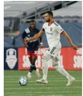
REVS_II_vs_RED_WOLVES...REVS_II_vs_RED_WOLVES...REVS_II_vs_RED_WOLVES...REVS_II_vs_RED_WOLVES... CAP2020USL1 RIICRW1163 CAP2020USL1 RIICRW0454 CAP2020USL1 RIICRW0268 CAP2020USL1 RIICRW0666