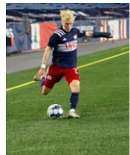
REVS_II_vs_RED_WOLVES...REVS_II_vs_RED_WOLVES...REVS_II_vs_RED_WOLVES...REVS_II_vs_RED_WOLVES... CAP2020USL1 RIICRW1296 CAP2020USL1 RIICRW0364 CAP2020USL1 RIICRW1210 CAP2020USL1 RIICRW0018