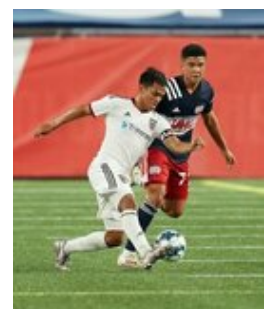
REVS_II_vs_RED_WOLVES_...REVS_II_vs_RED_WOLVES_...REVS_II_vs_RED_WOLVES_...REVS_II_vs_RED_WOLVES_... CAP2020USL1 RIICRW0195 CAP2020USL1 RIICRW0378 CAP2020USL1 RIICRW1219 CAP2020USL1 RIICRW0899