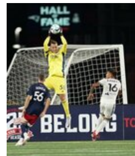
REVS_II_vs_RED_WOLVES_...REVS_II_vs_RED_WOLVES_...REVS_II_vs_RED_WOLVES_...REVS_II_vs_RED_WOLVES_... CAP2020USL1 RIICRW1368 CAP2020USL1 RIICRW0547 CAP2020USL1 RIICRW1010 CAP2020USL1 RIICRW0650