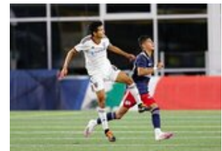
REVS_II_vs_RED_WOLVES_...REVS_II_vs_RED_WOLVES_...REVS_II_vs_RED_WOLVES_...REVS_II_vs_RED_WOLVES_... CAP2020USL1 RIICRW0759 CAP2020USL1 RIICRW0007 CAP2020USL1 RIICRW0114 CAP2020USL1 RIICRW0141