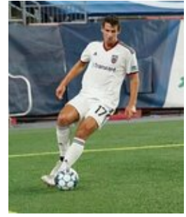
REVS_II_vs_RED_WOLVES_...REVS_II_vs_RED_WOLVES_...REVS_II_vs_RED_WOLVES_...REVS_II_vs_RED_WOLVES_... CAP2020USL1 RIICRW0791 CAP2020USL1 RIICRW1312 CAP2020USL1 RIICRW1382 CAP2020USL1 RIICRW1227