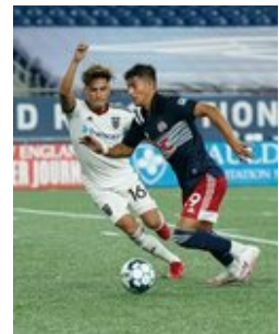
REVS_II_vs_RED_WOLVES_...REVS_II_vs_RED_WOLVES_...REVS_II_vs_RED_WOLVES_...REVS_II_vs_RED_WOLVES_... CAP2020USL1 RIICRW0651 CAP2020USL1 RIICRW1380 CAP2020USL1 RIICRW0064 CAP2020USL1 RIICRW1126