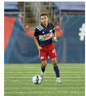
REVS_II_vs_RED_WOLVES_...REVS_II_vs_RED_WOLVES_...REVS_II_vs_RED_WOLVES_...REVS_II_vs_RED_WOLVES_... CAP2020USL1 RIICRW0098 CAP2020USL1 RIICRW1248 CAP2020USL1 RIICRW0096 CAP2020USL1 RIICRW1023