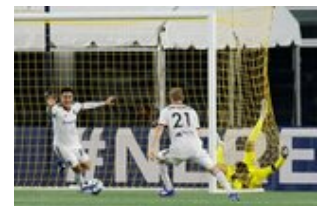
REVS_II_vs_RED_WOLVES...REVS_II_vs_RED_WOLVES...REVS_II_vs_RED_WOLVES...REVS_II_vs_RED_WOLVES... CAP2020USL1 RIICRW1302 CAP2020USL1 RIICRW1014 CAP2020USL1 RIICRW0199 CAP2020USL1 RIICRW0228