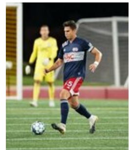
REVS_II_vs_RED_WOLVES_...REVS_II_vs_RED_WOLVES_...REVS_II_vs_RED_WOLVES_...REVS_II_vs_RED_WOLVES_... CAP2020USL1 RIICRW0058 CAP2020USL1 RIICRW0153 CAP2020USL1 RIICRW1194 CAP2020USL1 RIICRW0591