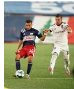
REVS_II_vs_RED_WOLVES_...REVS_II_vs_RED_WOLVES_...REVS_II_vs_RED_WOLVES_...REVS_II_vs_RED_WOLVES_... CAP2020USL1 RIICRW0296 CAP2020USL1 RIICRW0299 CAP2020USL1 RIICRW1208 CAP2020USL1 RIICRW0595