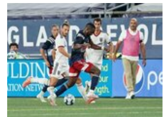
REVS_II_vs_RED_WOLVES_...REVS_II_vs_RED_WOLVES_...REVS_II_vs_RED_WOLVES_...REVS_II_vs_RED_WOLVES_... CAP2020USL1 RIICRW1140 CAP2020USL1 RIICRW0456 CAP2020USL1 RIICRW1393 CAP2020USL1 RIICRW1042