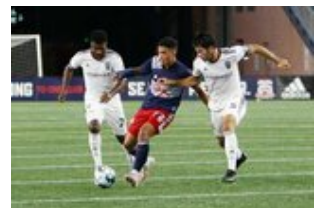
REVS_II_vs_RED_WOLVES_...REVS_II_vs_RED_WOLVES_...REVS_II_vs_RED_WOLVES_...REVS_II_vs_RED_WOLVES_... CAP2020USL1 RIICRW0444 CAP2020USL1 RIICRW0161 CAP2020USL1 RIICRW0260 CAP2020USL1 RIICRW0026