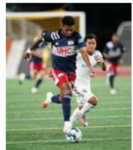
REVS_II_vs_RED_WOLVES...REVS_II_vs_RED_WOLVES...REVS_II_vs_RED_WOLVES...REVS_II_vs_RED_WOLVES... CAP2020USL1 RIICRW1288 CAP2020USL1 RIICRW1366 CAP2020USL1 RIICRW0073 CAP2020USL1 RIICRW0630