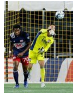
REVS_II_vs_RED_WOLVES...REVS_II_vs_RED_WOLVES...REVS_II_vs_RED_WOLVES...REVS_II_vs_RED_WOLVES... CAP2020USL1 RIICRW1340 CAP2020USL1 RIICRW0674 CAP2020USL1 RIICRW0562 CAP2020USL1 RIICRW0121