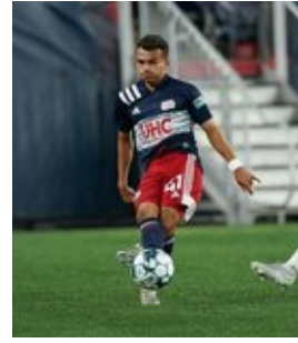
REVS_II_vs_RED_WOLVES_...REVS_II_vs_RED_WOLVES_...REVS_II_vs_RED_WOLVES_...REVS_II_vs_RED_WOLVES_... CAP2020USL1 RIICRW0046 CAP2020USL1 RIICRW0144 CAP2020USL1 RIICRW1354 CAP2020USL1 RIICRW0555