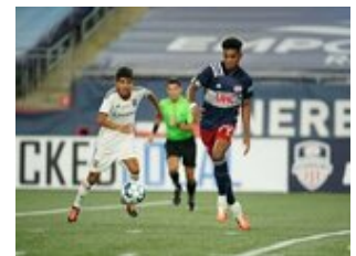
REVS_II_vs_RED_WOLVES_...REVS_II_vs_RED_WOLVES_...REVS_II_vs_RED_WOLVES_...REVS_II_vs_RED_WOLVES_... CAP2020USL1 RIICRW1076 CAP2020USL1 RIICRW0249 CAP2020USL1 RIICRW0107 CAP2020USL1 RIICRW0527