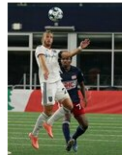
REVS_II_vs_RED_WOLVES...REVS_II_vs_RED_WOLVES...REVS_II_vs_RED_WOLVES...REVS_II_vs_RED_WOLVES... CAP2020USL1 RIICRW0563 CAP2020USL1 RIICRW1238 CAP2020USL1 RIICRW1092 CAP2020USL1 RIICRW1165