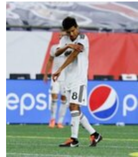
REVS_II_vs_RED_WOLVES_...REVS_II_vs_RED_WOLVES_...REVS_II_vs_RED_WOLVES_...REVS_II_vs_RED_WOLVES_... CAP2020USL1 RIICRW0065 CAP2020USL1 RIICRW0433 CAP2020USL1 RIICRW0234 CAP2020USL1 RIICRW0210