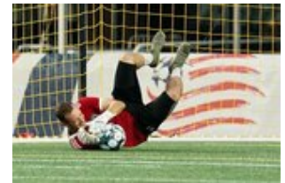
REVS_II_vs_RED_WOLVES_...REVS_II_vs_RED_WOLVES_...REVS_II_vs_RED_WOLVES_...REVS_II_vs_RED_WOLVES_... CAP2020USL1 RIICRW1395 CAP2020USL1 RIICRW0654 CAP2020USL1 RIICRW0940 CAP2020USL1 RIICRW0438