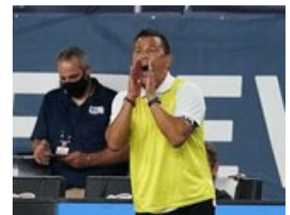
REVS_II_vs_RED_WOLVES_...REVS_II_vs_RED_WOLVES_...REVS_II_vs_RED_WOLVES_...REVS_II_vs_RED_WOLVES_... CAP2020USL1 RIICRW1012 CAP2020USL1 RIICRW0231 CAP2020USL1 RIICRW0838 CAP2020USL1 RIICRW0637