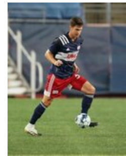
REVS_II_vs_RED_WOLVES_...REVS_II_vs_RED_WOLVES_...REVS_II_vs_RED_WOLVES_...REVS_II_vs_RED_WOLVES_... CAP2020USL1 RIICRW0189 CAP2020USL1 RIICRW0111 CAP2020USL1 RIICRW0731 CAP2020USL1 RIICRW0786