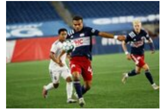
REVS_II_vs_RED_WOLVES_...REVS_II_vs_RED_WOLVES_...REVS_II_vs_RED_WOLVES_...REVS_II_vs_RED_WOLVES_... CAP2020USL1 RIICRW1001 CAP2020USL1 RIICRW0188 CAP2020USL1 RIICRW1203 CAP2020USL1 RIICRW0015