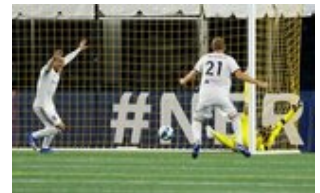
REVS_II_vs_RED_WOLVES...REVS_II_vs_RED_WOLVES...REVS_II_vs_RED_WOLVES...REVS_II_vs_RED_WOLVES... CAP2020USL1 RIICRW0579 CAP2020USL1 RIICRW0311 CAP2020USL1 RIICRW0366 CAP2020USL1 RIICRW0227