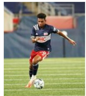
REVS_II_vs_RED_WOLVES...REVS_II_vs_RED_WOLVES...REVS_II_vs_RED_WOLVES...REVS_II_vs_RED_WOLVES... CAP2020USL1 RIICRW1284 CAP2020USL1 RIICRW0221 CAP2020USL1 RIICRW0695 CAP2020USL1 RIICRW0613