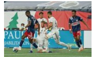
REVS_II_vs_RED_WOLVES...REVS_II_vs_RED_WOLVES...REVS_II_vs_RED_WOLVES...REVS_II_vs_RED_WOLVES... CAP2020USL1 RIICRW1035 CAP2020USL1 RIICRW1068 CAP2020USL1 RIICRW0429 CAP2020USL1 RIICRW0743