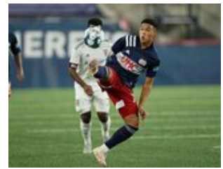
REVS_II_vs_RED_WOLVES_...REVS_II_vs_RED_WOLVES_...REVS_II_vs_RED_WOLVES_...REVS_II_vs_RED_WOLVES_... CAP2020USL1 RIICRW1334 CAP2020USL1 RIICRW0660 CAP2020USL1 RIICRW1054 CAP2020USL1 RIICRW0501