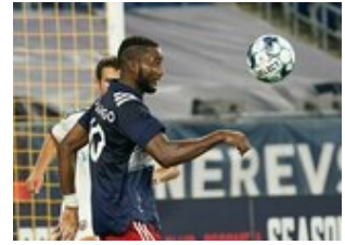
REVS_II_vs_RED_WOLVES...REVS_II_vs_RED_WOLVES...REVS_II_vs_RED_WOLVES...REVS_II_vs_RED_WOLVES... CAP2020USL1 RIICRW0618 CAP2020USL1 RIICRW0309 CAP2020USL1 RIICRW1297 CAP2020USL1 RIICRW1211