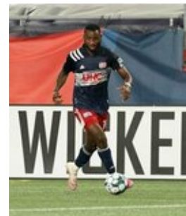
REVS_II_vs_RED_WOLVES...REVS_II_vs_RED_WOLVES...REVS_II_vs_RED_WOLVES...REVS_II_vs_RED_WOLVES... CAP2020USL1 RIICRW0644 CAP2020USL1 RIICRW0154 CAP2020USL1 RIICRW1029 CAP2020USL1 RIICRW0981