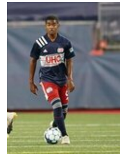
REVS_II_vs_RED_WOLVES_...REVS_II_vs_RED_WOLVES_...REVS_II_vs_RED_WOLVES_...REVS_II_vs_RED_WOLVES_... CAP2020USL1 RIICRW0343 CAP2020USL1 RIICRW0001 CAP2020USL1 RIICRW1376 CAP2020USL1 RIICRW0739