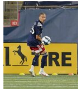
REVS_II_vs_RED_WOLVES_...REVS_II_vs_RED_WOLVES_...REVS_II_vs_RED_WOLVES_...REVS_II_vs_RED_WOLVES_... CAP2020USL1 RIICRW1445 CAP2020USL1 RIICRW0076 CAP2020USL1 RIICRW1102 CAP2020USL1 RIICRW0599