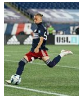
REVS_II_vs_RED_WOLVES_...REVS_II_vs_RED_WOLVES_...REVS_II_vs_RED_WOLVES_...REVS_II_vs_RED_WOLVES_... CAP2020USL1 RIICRW0024 CAP2020USL1 RIICRW0118 CAP2020USL1 RIICRW1083 CAP2020USL1 RIICRW1141