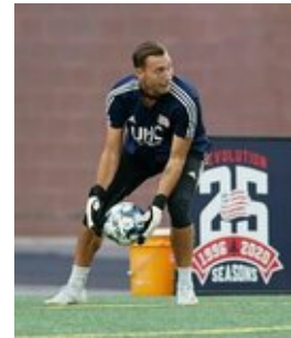
REVS_II_vs_RED_WOLVES...REVS_II_vs_RED_WOLVES...REVS_II_vs_RED_WOLVES...REVS_II_vs_RED_WOLVES... CAP2020USL1 RIICRW0931 CAP2020USL1 RIICRW0656 CAP2020USL1 RIICRW1124 CAP2020USL1 RIICRW0383