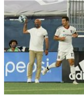
REVS_II_vs_RED_WOLVES_...REVS_II_vs_RED_WOLVES_...REVS_II_vs_RED_WOLVES_...REVS_II_vs_RED_WOLVES_... CAP2020USL1 RIICRW0287 CAP2020USL1 RIICRW0783 CAP2020USL1 RIICRW0149 CAP2020USL1 RIICRW0513