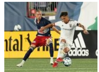
REVS_II_vs_RED_WOLVES_...REVS_II_vs_RED_WOLVES_...REVS_II_vs_RED_WOLVES_...REVS_II_vs_RED_WOLVES_... CAP2020USL1 RIICRW0471 CAP2020USL1 RIICRW0245 CAP2020USL1 RIICRW1353 CAP2020USL1 RIICRW0697