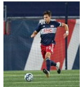
REVS_II_vs_RED_WOLVES...REVS_II_vs_RED_WOLVES...REVS_II_vs_RED_WOLVES...REVS_II_vs_RED_WOLVES... CAP2020USL1 RIICRW0049 CAP2020USL1 RIICRW0247 CAP2020USL1 RIICRW1187 CAP2020USL1 RIICRW0516