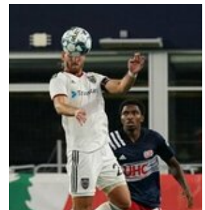
REVS_II_vs_RED_WOLVES...REVS_II_vs_RED_WOLVES...REVS_II_vs_RED_WOLVES...REVS_II_vs_RED_WOLVES... CAP2020USL1 RIICRW0869 CAP2020USL1 RIICRW0042 CAP2020USL1 RIICRW0152 CAP2020USL1 RIICRW1164