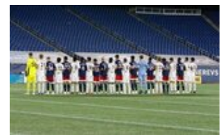
REVS_II_vs_RED_WOLVES_...REVS_II_vs_RED_WOLVES_...REVS_II_vs_RED_WOLVES_...REVS_II_vs_RED_WOLVES_... CAP2020USL1 RIICRW0156 CAP2020USL1 RIICRW0215 CAP2020USL1 RIICRW0898 CAP2020USL1 RIICRW0009