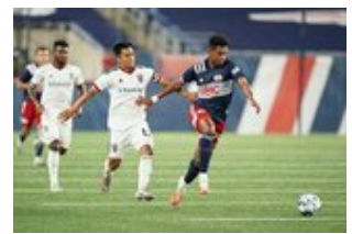
REVS_II_vs_RED_WOLVES...REVS_II_vs_RED_WOLVES...REVS_II_vs_RED_WOLVES...REVS_II_vs_RED_WOLVES... CAP2020USL1 RIICRW0852 CAP2020USL1 RIICRW1370 CAP2020USL1 RIICRW0063 CAP2020USL1 RIICRW0623