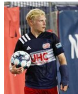
REVS_II_vs_RED_WOLVES_...REVS_II_vs_RED_WOLVES_...REVS_II_vs_RED_WOLVES_...REVS_II_vs_RED_WOLVES_... CAP2020USL1 RIICRW0241 CAP2020USL1 RIICRW1412 CAP2020USL1 RIICRW0668 CAP2020USL1 RIICRW0038