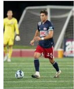
REVS_II_vs_RED_WOLVES...REVS_II_vs_RED_WOLVES...REVS_II_vs_RED_WOLVES...REVS_II_vs_RED_WOLVES... CAP2020USL1 RIICRW0719 CAP2020USL1 RIICRW1113 CAP2020USL1 RIICRW1017 CAP2020USL1 RIICRW0589