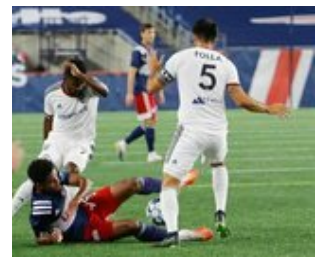
REVS_II_vs_RED_WOLVES...REVS_II_vs_RED_WOLVES...REVS_II_vs_RED_WOLVES...REVS_II_vs_RED_WOLVES... CAP2020USL1 RIICRW1243 CAP2020USL1 RIICRW0095 CAP2020USL1 RIICRW1200 CAP2020USL1 RIICRW0010