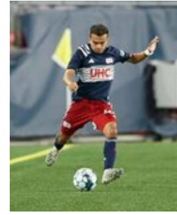
REVS_II_vs_RED_WOLVES...REVS_II_vs_RED_WOLVES...REVS_II_vs_RED_WOLVES...REVS_II_vs_RED_WOLVES... CAP2020USL1 RIICRW1294 CAP2020USL1 RIICRW1369 CAP2020USL1 RIICRW1115 CAP2020USL1 RIICRW0703