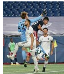
REVS_II_vs_RED_WOLVES_...REVS_II_vs_RED_WOLVES_...REVS_II_vs_RED_WOLVES_...REVS_II_vs_RED_WOLVES_... CAP2020USL1 RIICRW1253 CAP2020USL1 RIICRW1158 CAP2020USL1 RIICRW0457 CAP2020USL1 RIICRW1336