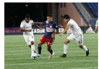
REVS_II_vs_RED_WOLVES_...REVS_II_vs_RED_WOLVES_...REVS_II_vs_RED_WOLVES_...REVS_II_vs_RED_WOLVES_... CAP2020USL1 RIICRW0462 CAP2020USL1 RIICRW1066 CAP2020USL1 RIICRW1031 CAP2020USL1 RIICRW0025