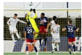
REVS_II_vs_RED_WOLVES...REVS_II_vs_RED_WOLVES...REVS_II_vs_RED_WOLVES...REVS_II_vs_RED_WOLVES... CAP2020USL1 RIICRW0041 CAP2020USL1 RIICRW0925 CAP2020USL1 RIICRW0494 CAP2020USL1 RIICRW0169