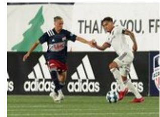
REVS_II_vs_RED_WOLVES...REVS_II_vs_RED_WOLVES...REVS_II_vs_RED_WOLVES...REVS_II_vs_RED_WOLVES... CAP2020USL1 RIICRW0484 CAP2020USL1 RIICRW0173 CAP2020USL1 RIICRW1350 CAP2020USL1 RIICRW0686