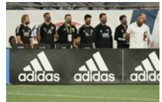
REVS_II_vs_RED_WOLVES_...REVS_II_vs_RED_WOLVES_...REVS_II_vs_RED_WOLVES_...REVS_II_vs_RED_WOLVES_... CAP2020USL1 RIICRW1423 CAP2020USL1 RIICRW0047 CAP2020USL1 RIICRW0955 CAP2020USL1 RIICRW0465