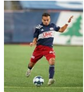
REVS_II_vs_RED_WOLVES_...REVS_II_vs_RED_WOLVES_...REVS_II_vs_RED_WOLVES_...REVS_II_vs_RED_WOLVES_... CAP2020USL1 RIICRW1285 CAP2020USL1 RIICRW1359 CAP2020USL1 RIICRW0070 CAP2020USL1 RIICRW0594