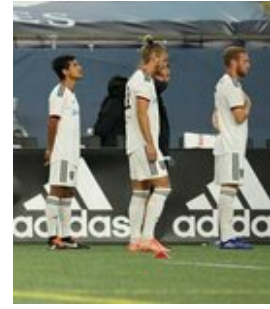
REVS_II_vs_RED_WOLVES_...REVS_II_vs_RED_WOLVES_...REVS_II_vs_RED_WOLVES_...REVS_II_vs_RED_WOLVES_... CAP2020USL1 RIICRW0037 CAP2020USL1 RIICRW1267 CAP2020USL1 RIICRW1151 CAP2020USL1 RIICRW0459