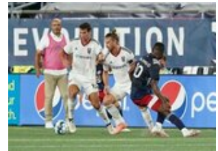
REVS_II_vs_RED_WOLVES_...REVS_II_vs_RED_WOLVES_...REVS_II_vs_RED_WOLVES_...REVS_II_vs_RED_WOLVES_... CAP2020USL1 RIICRW0237 CAP2020USL1 RIICRW0216 CAP2020USL1 RIICRW0662 CAP2020USL1 RIICRW1046