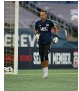
REVS_II_vs_RED_WOLVES...REVS_II_vs_RED_WOLVES...REVS_II_vs_RED_WOLVES...REVS_II_vs_RED_WOLVES... CAP2020USL1 RIICRW1117 CAP2020USL1 RIICRW0649 CAP2020USL1 RIICRW1301 CAP2020USL1 RIICRW0368